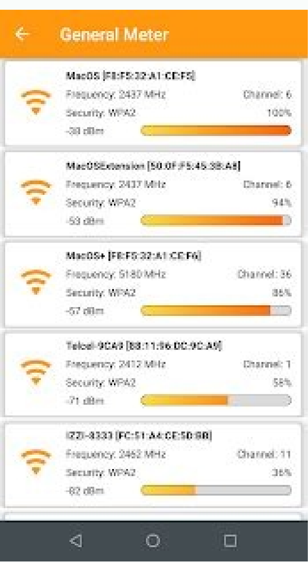
Android ssid 確認. Ssid 確認方法 android.