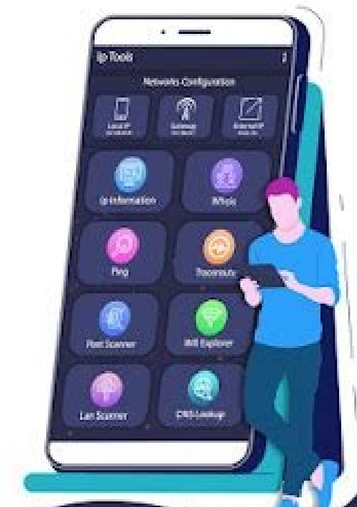
IP Tools (IP Info, Local IP, Gateway, Host) - Router Admin Setup & Network Utilities